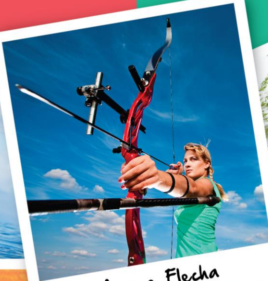
Arco e Flecha