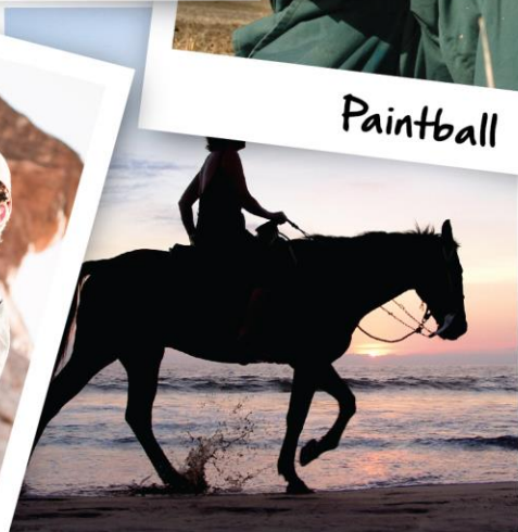
Passeios a Cavalo