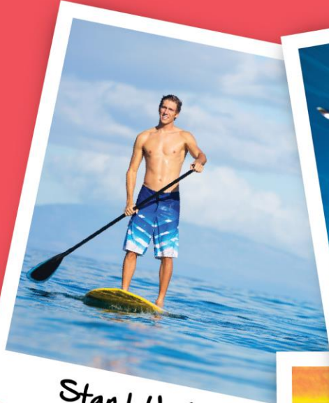
Stand Up Paddle