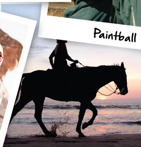
Passeios a Cavalo