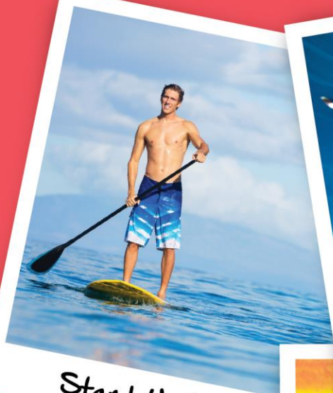
Stand Up Paddle